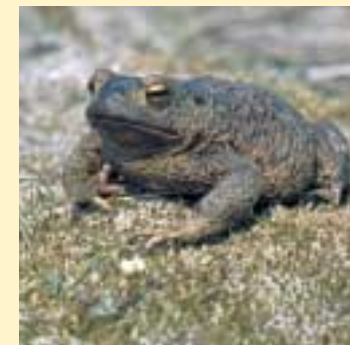
Gewone pad (Rein van Rossum)

Door herinrichting van het gebied moet een deel van het oude duinlandschap terugkeren met bloemrijke duingraslanden, duinstruwe-len, paddepoelen en duin-beekjes.